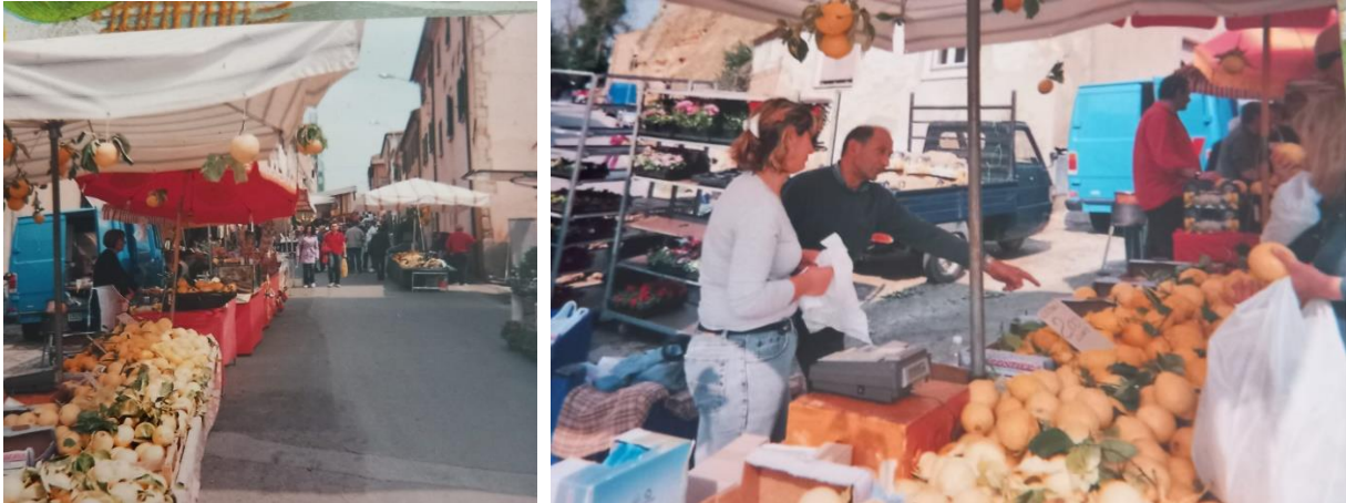
Festa del Cedro a Bibbona

La festa del Mezzandì è stata ribattezzata festa del Cedro negli anni '80 del 1900.